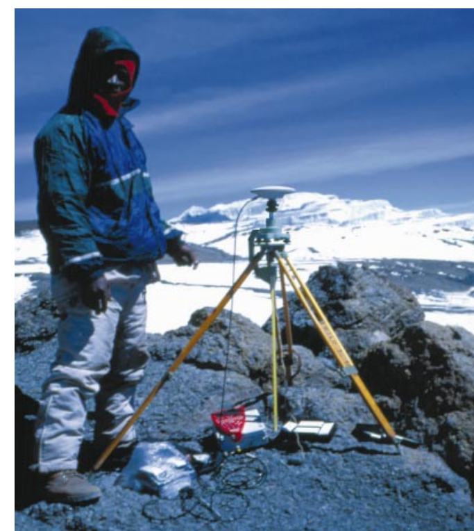
dem Gillmans-Point als Referenzstation diente.

randes eineinhalb Stunden vorzusehen waren und da dieser Teil sehr anstrengend war, wurde die Ausrüstung auf ein Minimum reduziert. Die Entscheidung, anstatt eines Statives einen leichten Karbonfaser-Lotstock mit nach oben zu nehmen, erwies sich als richtig. Der Lotstock wurde auf dem höchsten Rand des Kraters direkt neben der Tafel aufgesetzt, welche den Gipfelpunkt markiert. Zusätzlich wurden mehrere fliegende Initialisierungen gestartet, wobei der Empfänger auf