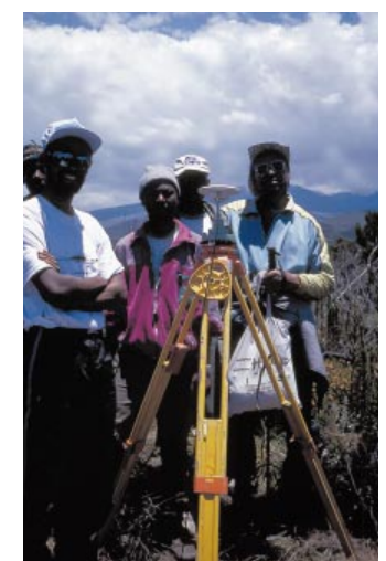
Das Vermessungsteam mit Leica SR530 bei Mandara Juu (2845 m).

Da zwischen Gillmans-Point und dem Uhuru Gipfelpunkt für die verbleibenden 200 m Anstieg und zwei Kilometer Weg entlang des Krater-