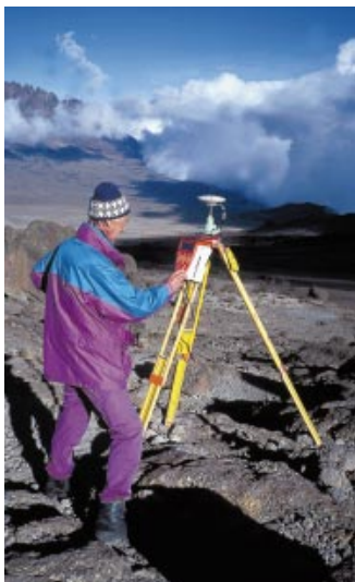
GPS-Messung an der Kibo-Hütte (4700 m), mit Blick auf den Mawzeni (5149 m).

zentimetergenau zu bestimmen. Anschliessend wurde das gesamte Netz sowohl mit der Berner Software als auch mit dem SKI-Programm berechnet, wobei die Resultate sehr gut übereinstimmten. Die Ellipsoid-Höhe des Uhuru-Peaks wurde mit 5875,50 m berechnet und ist sicher auf fünf Zentimeter genau. Eine orthometrische Höhe von 5891,77 m ergab sich nach Einbezug des EGM96-Geoidmodells, doch ist dabei zu berücksichtigen, dass die Unsicherheit dieses Modells für diesen Teil Afrikas in der Grössenordnung von einem Meter liegt. Da alle bestehenden Triangulationspunkte und Referenzstationen südlich des Berggipfels liegen und nicht von gleich guter Qualität sind, war es nicht möglich, eine rigorose Transformation auf das Höhendatum von Tanzania vorzunehmen, sondern