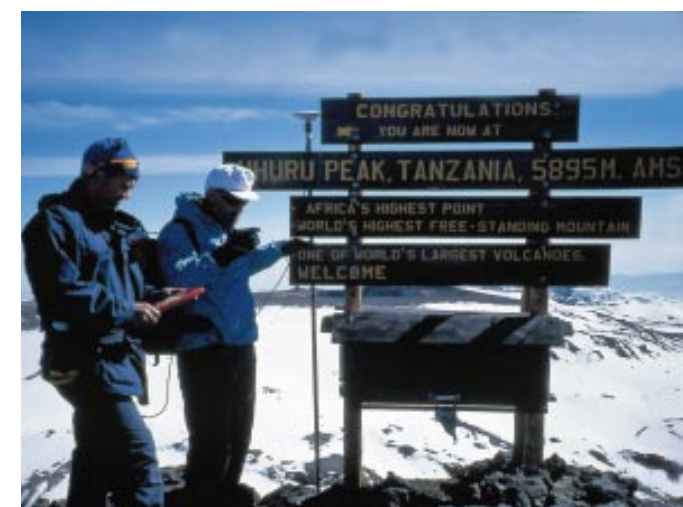
Fliegende Initialisierung auf dem Uhuru-Peak (5893 m).